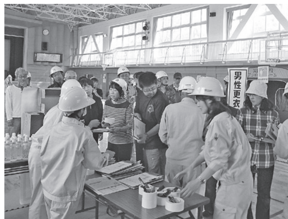
←炊き出しのご飯や飲料水 また名簿が配布されている様子