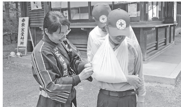
←女性消防隊による救急講習会