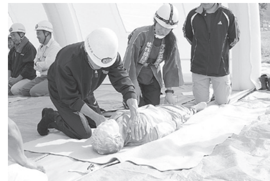
昨年の防災訓練の様子