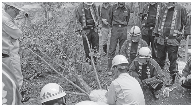
↑木流し工法の様子