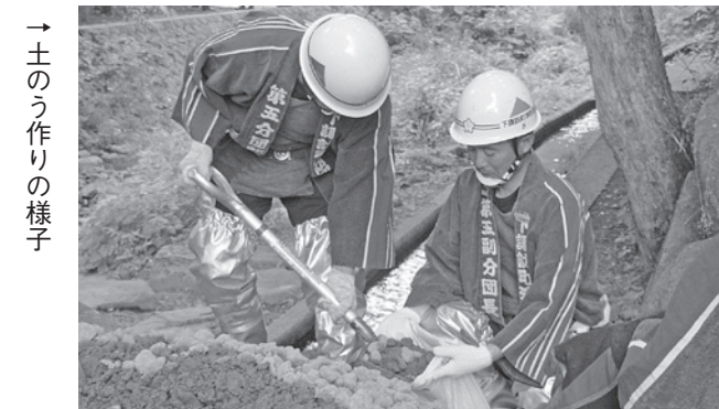
→土のう作りの様子