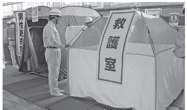
↑テントなどでプライベートルームを設置