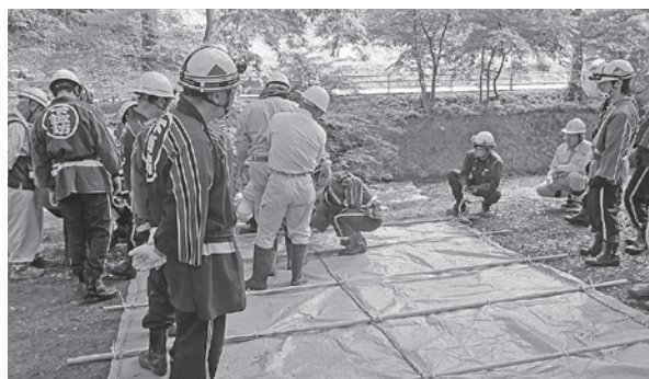
←シート張り工法の様子