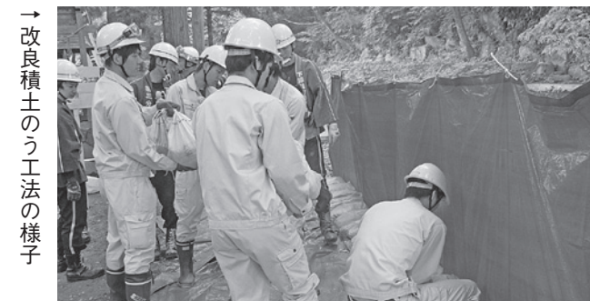
→改良積土のう工法の様子