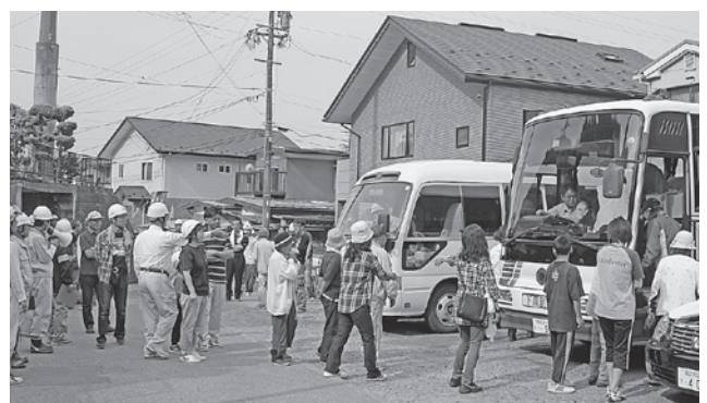
↑自宅から北小に避難するためバスに乗り込む参加者

また同日、東町中2の住民の方々を対象とした自宅から北小までの避難誘導訓練を実施しました。その様子を写真でご紹介します。