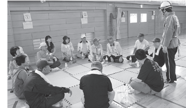
↑避難完了後各グループで反省点などを話し合う